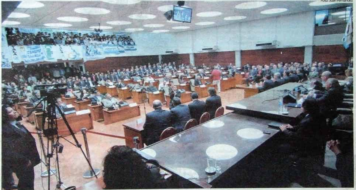
ASAMBLEA LEGISLATIVA EL RECINTO DE LA CÁMARA DE DIPUTADOS A PLENO PARA ESCUCHAR EL MENSAJE DEL GOBERNADOR.